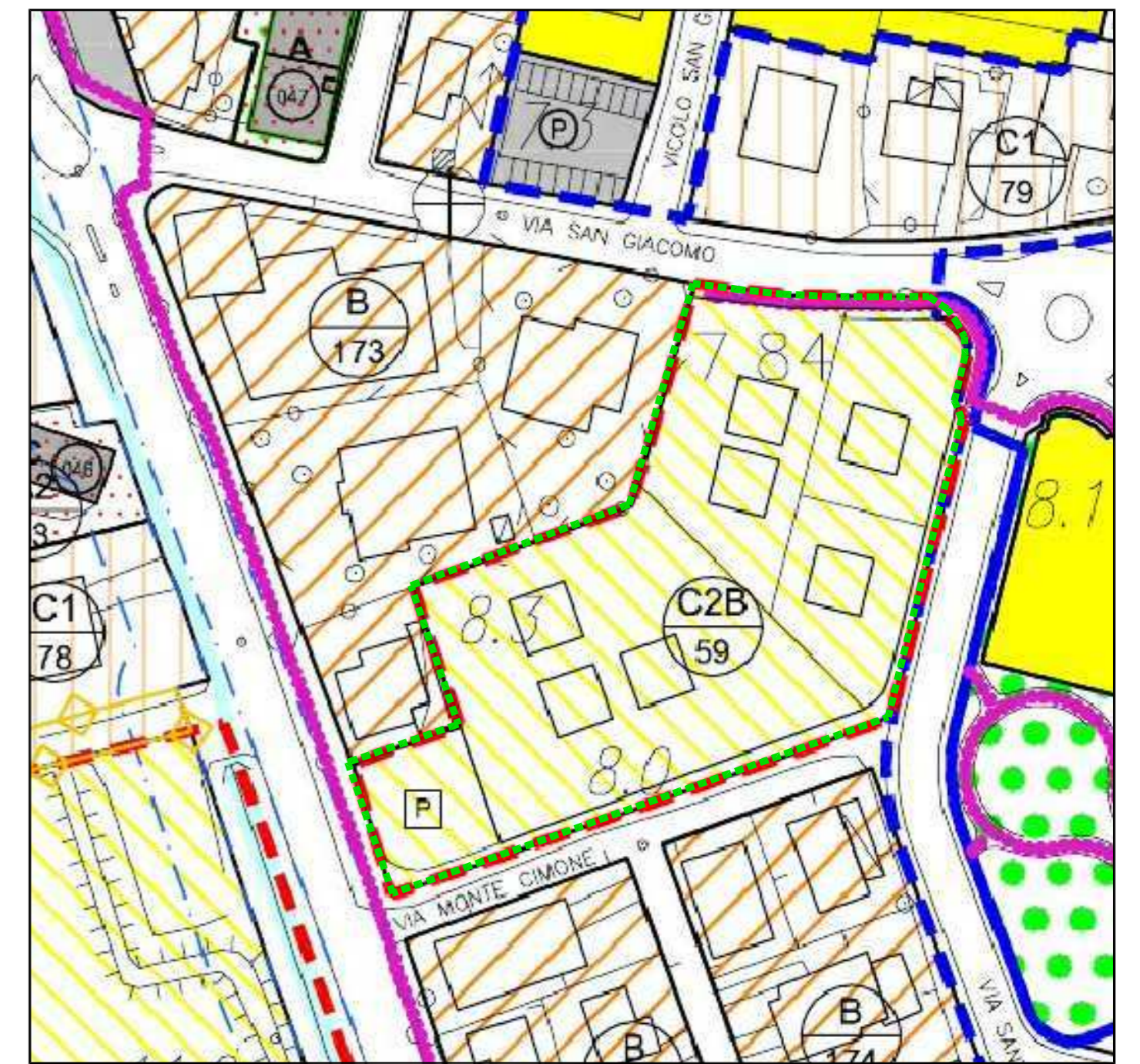
ESTRATTO P.I. CON EVIDENZIATO PERIMETRO AMBITO C2B/59 - scala 1:1000